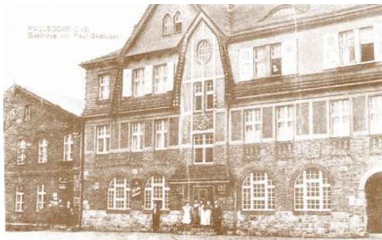
Restauracja Pawła Skoludka

Prężna współpraca z lokalnymi instytucjami jest dowodem na wyjątkową integrację mieszkańców naszej dzielnicy.