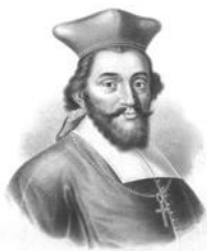
Jan Łaski (1456-1531)

Był arcybiskupem gnieźnieńskim i prymasem Polski w latach 1510-1531; kanclerz wielki koronny,